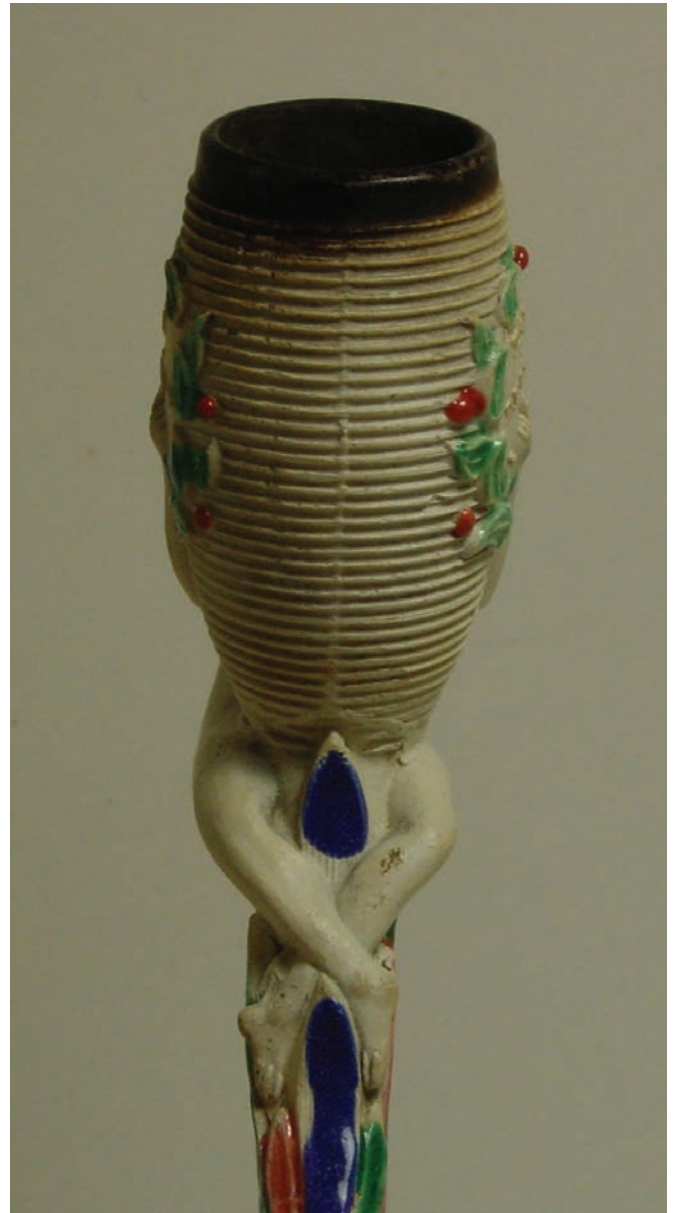
Afb. 9a-b. Pijp met carotte en naakte vrouw (detail).