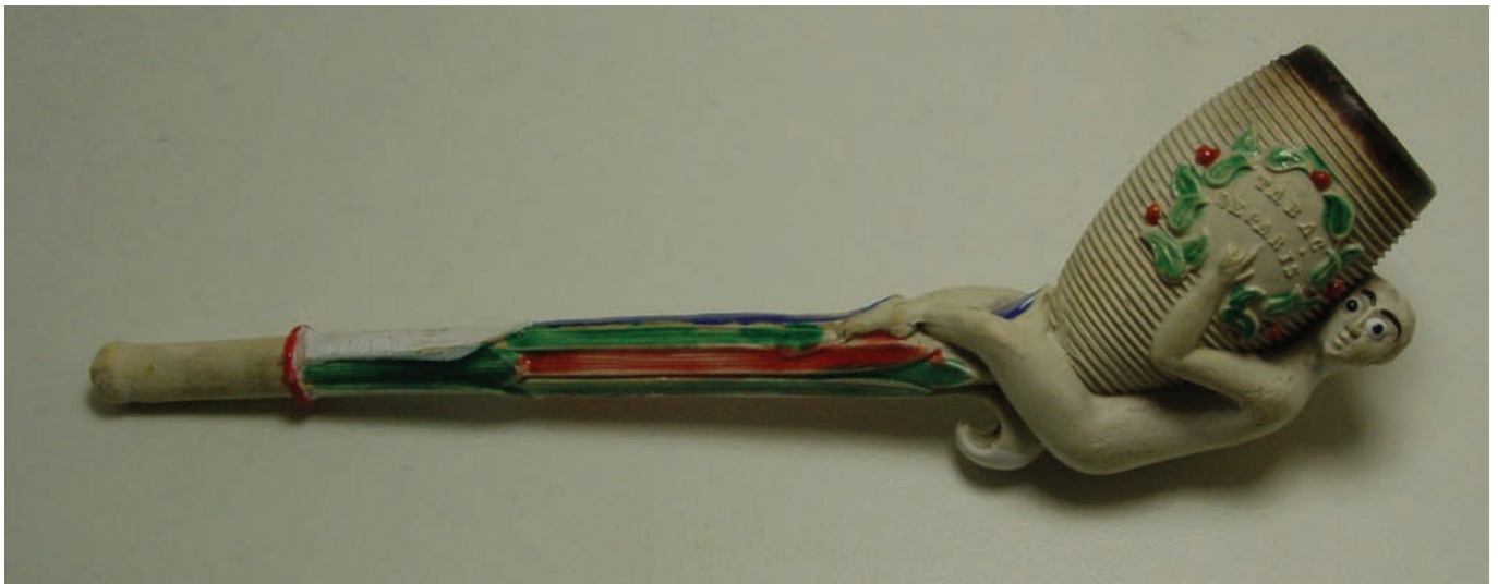
Afb. 7. Pijp met carotte en naakte vrouw met tekst: 'Pipe Gambier' en 'Tabac de Paris'. Gambier, Givet. Collectie en foto auteur.