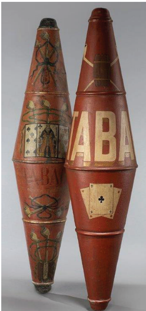
Afb. 2. Carotte, voormalige collectie Musée du Seita, circa 1900.