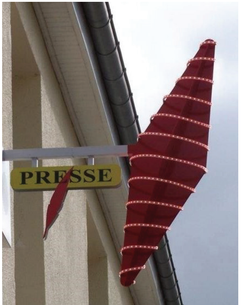
Afb. 3. Moderne uitvoering van de carotte.