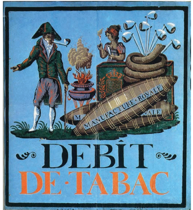
Afb. 1. Debit de tabac.

De carotte was een, aan beide zijden afgepunpte rol tabak, uit gezuiverde bladeren vervaardigd, om snuif van