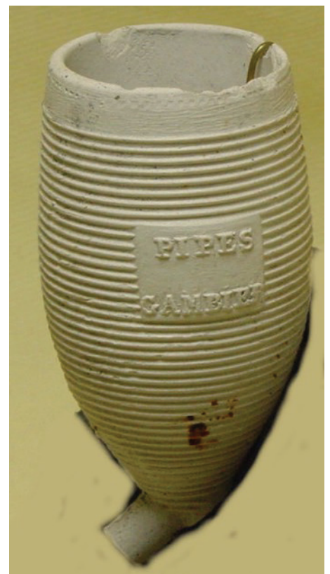
Afb. 6. Bodemvondst Givet. Collectie Declaf, Givet, Frankrijk.

Een variant op deze groep is nummer 292 uit de 6e serie van de catalogus van 1840. 4 Deze heeft een identieke decoratie met horizontale banden maar de bordjes met