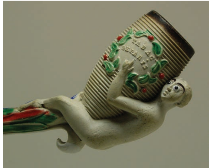
Afb. 8a-b. Pijp met carotte en naakte vrouw (detail).